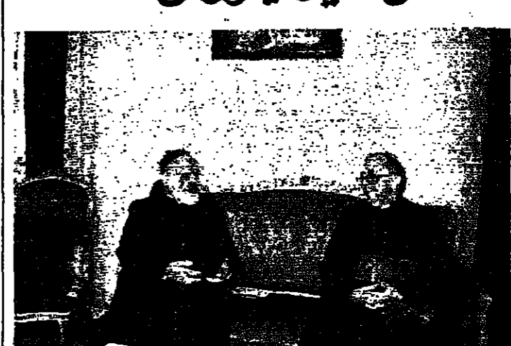
البريريك صغير والسفير الباسوي

الذي نحن فيه ؟ كيف تقوم الوضع الراهن ؟ القول انه مؤسوس منه. وبين... والصعوبات توجد الصعوبات المعيشية... والوضع الراهن في لبنان بأنه ليس سهلا... ولكن لا يمكن القول انه ميؤوس منه... استقبال البريريك الماروني من... نصرالله بطرس صفير في الحادية عشرة... قبل ظهر امس الاثنين في انجيلوني... وعرض معه التطورات عموما... بعد اللقاء قال انجيلوني انها زيارة... تقليدية كونه يوجد بين الكرسي الرسولي... والبريريكية تقام تلم... وقد عرضنا مواضيع الساعة ان على... الصعيد السياسي العام على الصعيد... الكنسي وتامل جميعا الخروج من المازق